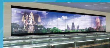
東京国際空港ターミナル株式会社様 羽田空港

圧倒的な迫力と豊かな映像表現を、プランニング から設置後の運営まで、ワンストップサービスで お届けします。